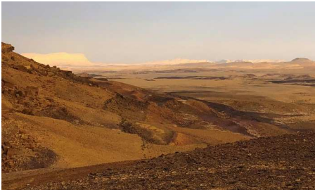
Arrivée en Terre Sainte