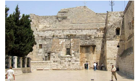
Bethléem Luc 1 et Luc 3