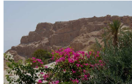
Sur l'Horeb (Rois 18,9)