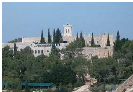
Repartir en témoins d'Espérance