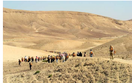
Genèse et Exode Le buisson ardent